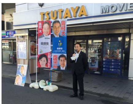
9. 12. 保土ヶ谷駅前で 朝の挨拶 近頃は桜木町や関内でも