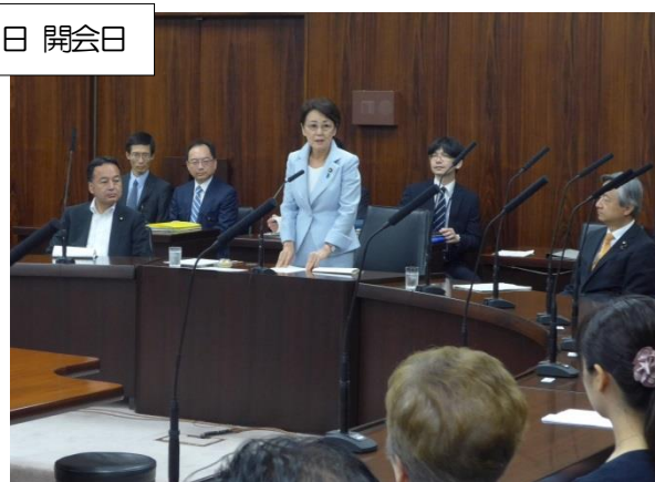
北朝鮮による拉致問題等特別委員会