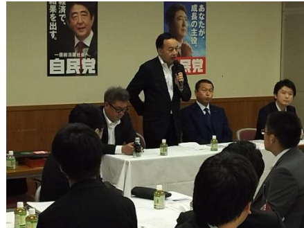
10. 1 かながわ自民党学生部勉強会 党本部でパネルディスカッション