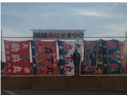
9. 25. 腰越（鎌倉市）みなとまつり 新鮮な魚や野菜の直売もありました