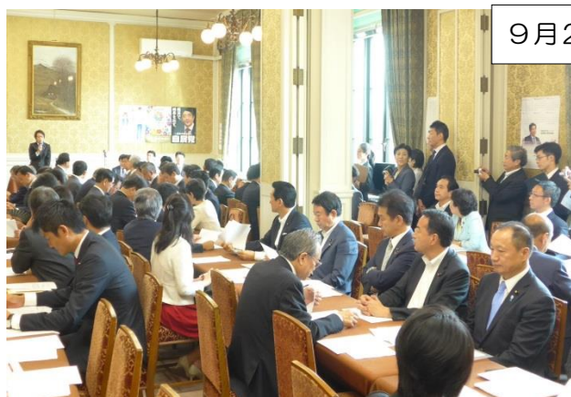
本会議前の議員総会

政府与党としては10月中旬までの補正予算案成立を目指し、その後衆議院の特別委員会でTPP承認に向けた議論に入る方向です。