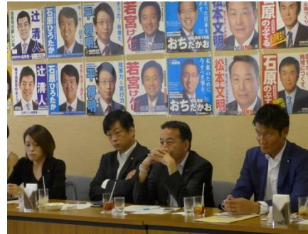
9. 29. ネットメディア局役員会 SNSなど広報の在り方を議論