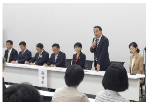
9. 26. JA 横浜学習会 都市農業の発展と充実に向けて