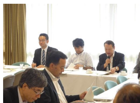
9. 27. 内閣第二部会 所轄は規制改革やTPP等