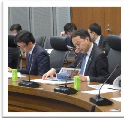
2. 22. 救急医療議員勉強会