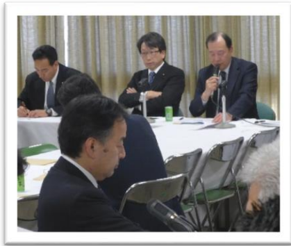
2.7.政治制度改革実行本部勉強会