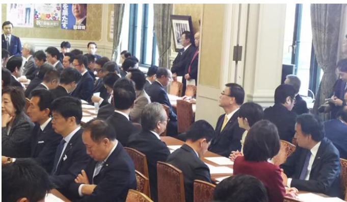
10月24日 本会議前の議員総会

政府与党としては11月初旬までの補正予算案成立を目指し、下旬には「出入国管理・難民認定法及び法務省設置法改正案」等の議論に入る見通しです。